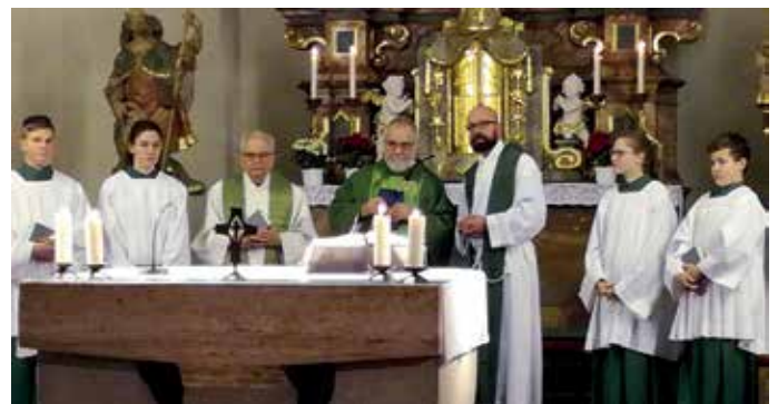
Intensive Gespräche gab es bei der Visitation in der SE Krebsbachtal/Hegau. Die Visitation endete mit der großen Danksagungsfeier, der Eucharistie, in der Pfarrkirche St. Ulrich.