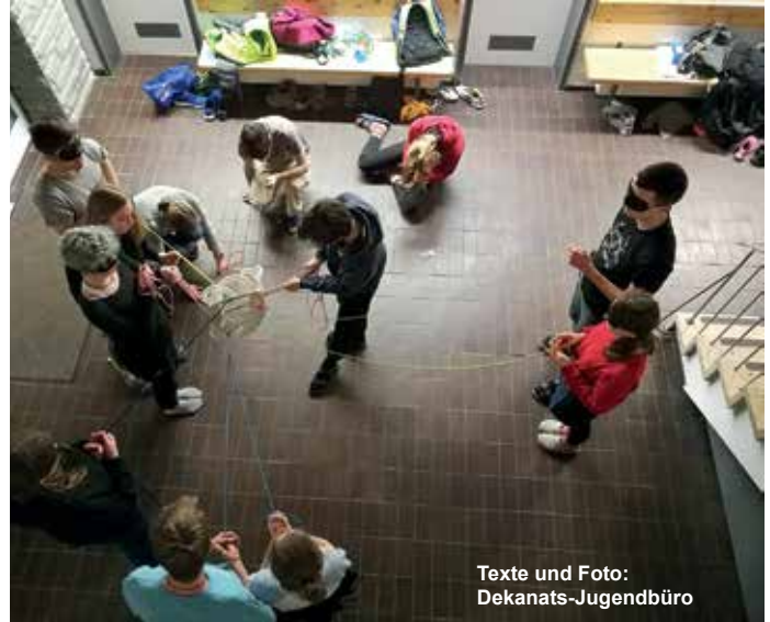
Texte und Foto: Dekanats-Jugendbüro

le aufbrachen. Neben dem Beten und Arbeiten blieb den Jugendlichen noch genug Zeit, gemeinsam die Freizeit zu verbringen. Es wurden Spiele gespielt, Joggingtouren am See entlang gemacht oder Zeit am nah gelegenen See ver-