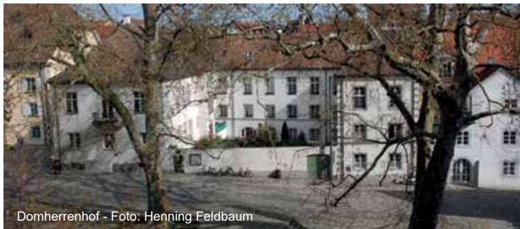
Domherrenhof - Foto: Henning Feldbaum

Mit der Enteignung der kirchlichen Gebäude nach 1803 kam auch der zuletzt „von Roll'sche“ Domherrenhof in den Besitz des Großherzogtums Baden und diente als „Bezirksamt“. Die chronische Geldnot der staatl. Domäne führte zum Verkauf an die Stadt, die gleichen Gründe zur Weiterveräußerung an den privaten Architekten Franz Haible 1889. Dieser überschrieb die umfangreichen Gebäude mit Garten