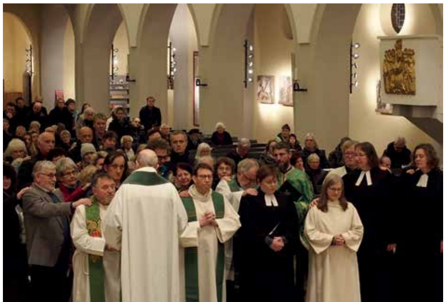
Handauflegung im Kirchenschiff: Im Gebet und durch Handauflegung bittet die Gemeinde um Gottes Segen für die „alten und neuen“ Klinikseelsorger/innen (29.01.)