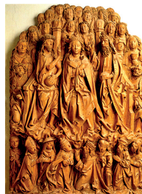
Abb. 5: Marienkrönung in Verbindung mit dem Motiv der Schutzmantelmadonna. Holzrelief vom Meister des Andelsbacher Altars (um 1530) aus der Kapelle der vierzehn Nothelfer auf Schloss Langenstein. Vorlage: Fredy Meyer