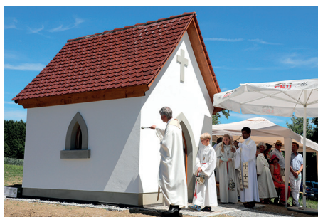
Abb. 3: Weihe der Kapelle der vierzehn Nothelfer in Schweingruben bei Raithaslach.

Über die Geschichte der zum Hofgut Hinterschweingruben gehörenden Kapelle und Wallfahrt haben wir leider nur wenige und dazu sehr spärliche Informationen. Nach dem ältesten Zeugnis, einem Situationsplan in einer Bauakte der Gräflich von Langenstein'schen Domänen Administration von 1879 steht sie in unmittelbarer Nähe zu der in der Straßenkurve gelegenen Hofanlage, neben einem vor 1879 abgebrannten Ökonomiegebäude und den Hofgebäuden auf der anderen Straßenseite, die später abgebrochen wurden.