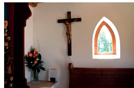
Abb. 2: Innenraum der vierzehn Nothelferkapelle in Schweingruben.