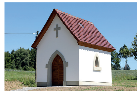
Abb. 1: Die Kapelle der vierzehn Nothelfer in Schweingruben.

Das heutige Kirchlein wurde im Jahre 1911 anstelle eines älteren Gebäudes im Stil der Neugotik erbaut. Es ist ein kleines aber feines Kapellheiligtum, das die Talauwe weithin überschaubar. Der rechteckige Innenraum ist nur ca. 6 qm groß. Er wird von zwei Holzbänken flankiert und durch zwei kleine Spitzbogenfenster erhellt. Das Satteldach ist mit Biberschwanzziegeln gedeckt. Wenn man das Heiligtum durch den spitzbogenförmigen Eingang betritt, fällt der Blick sofort auf das Gnadenbild, das auf der Stirnseite in einem schreinnähnlichen Rahmen mit schräg vorspringendem Dach angebracht ist.