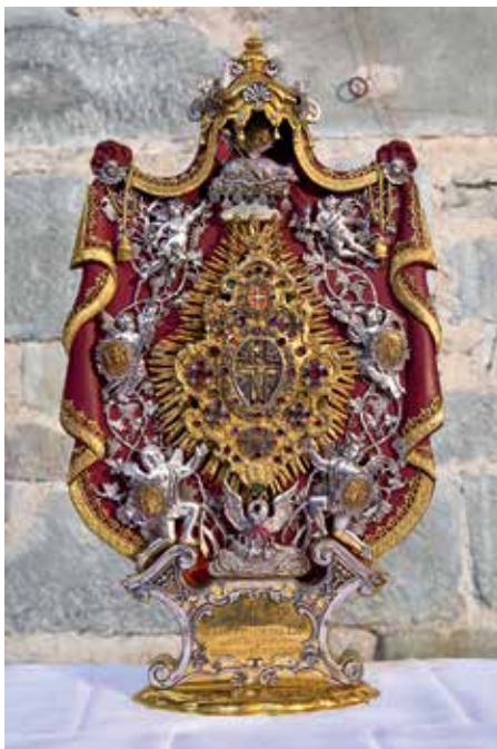
Heilig-Blut-Reliquie | Foto: Axel Morat

Do, 31.05. – Fronleichnam Münster, Mittelzell: 09.00 Uhr Hochamt (Münsterchor/-orchester u. Kirchenchöre Niederzell u. Oberzell: Eberlin Festmesse in C); anschl. Fronleichnamprozession