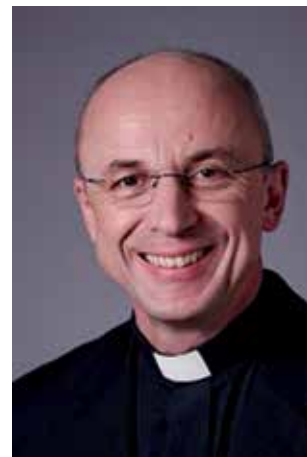
links