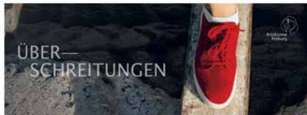
40 JAHRE PASTORALREFERENTINNE & PASTORALREFERENTEN ERZDIOZESE FREIBURG – KARLSRUHE – 6. MAI 2017