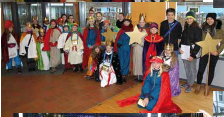
Die Sternsinger von KN St. Georg - Maria Hilf (links), Kaltbrunn (rechts oben) und Hegne (rechts unten)