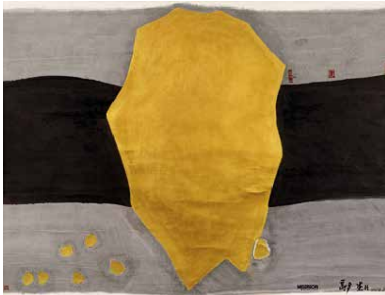
MISEREOR - Hungertuch 2015: Gott und Gold - wie viel ist genug?

Einzug bereits triumphal auch in die nicht religiösen oder besser gesagt, die „mens sana in corpore sana“-Lebensbereiche aller gehalten. Gerade in der Zeit, in der alle den Frühling herbeisehnen, werden wir im Fernsehen mit Slogans wie „I make you sexy!“ bombadiert und jede Zeitschrift, jedes Reformhaus hat ein noch besseres Rezept, die eigene Körperfülle zu reduzie-