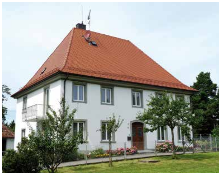
Pfarrhaus Liggeringen heute