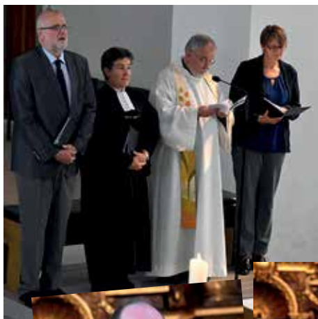
3 Fotos: Henning Feldbaum