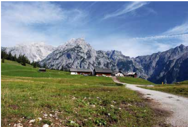
Walderalm im Karwendelgebirge, 1501m

Seit Anbeginn unseres Lebens, und ausdrücklich bestätigt in der Taufe, sind wir hineingenommen in eine ganz besondere Gemeinschaft mit Gott und untereinander. In jede und jeden von uns hat Gott eine Genialität und Einzigartigkeit hineingelegt, wie nur er bzw. sie und niemand sonst sein kann, unvertretbar, von niemandem ersetzbar.