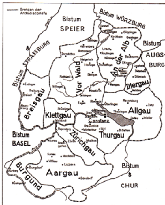
Die Diözese Konstanz mit ihren Grenzen und ihrer seit dem 13. Jahrhundert erkbaren inneren Gliederung in Archidiaconate

die Liturgie zu singen, geprüft wurde – waren die höheren Weihen möglich, wenn kein Defekt (uneheliche Geburt oder körperliche Behinderung) vorlag. Hiervon konnte der Bischof wiederum gegen Gebühr dispensieren. Dann galt es, eine Stelle zu finden: am besten eine Pfründe, die der Patronatsherr verlieh, wenn man Beziehungen und Geld hatte, ansonsten eine Stelle als Frühmessner oder Vikar, in der Hoffnung, aus dem „Kleriker-Proletariat“ irgendwann einmal aufzusteigen. Wer sich zum Eintritt in ein Kloster – etwa der Bettelorden – entschied, erlangte zwar sichere Unterkunft und Ernährung, gab dafür aber seine Freiheit auf. Schüler, die aus dem strengen Dienst als Chorknabe oder aus der Willkürherrschaft des Domherren, der Logis und karge Versorgung bot, flohen oder gar aus dem Kloster, wurden streng bestraft. Aus dieser Not heraus