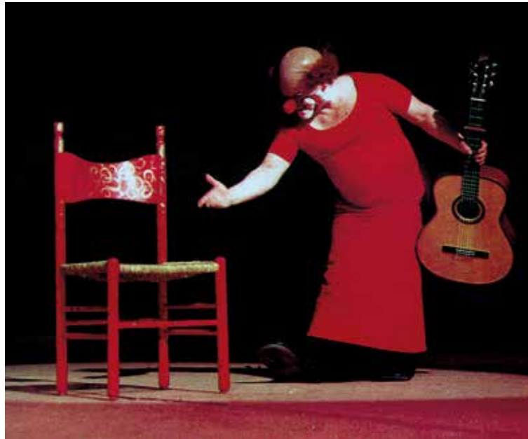
Charlie Rivel, Clown (1896 - 1983)

Heutzutage scheint sich die Fastnacht, trotz ihrer nachweislichen Ursprünge, jedoch weitgehend von diesen religiösen Hintergründen abgekoppelt zu haben, und zu den Masken und Häusern der „Traditionsfastnacht“ haben sich die Verkleidungen der Cowboys, Indianer, ... Aliens und Jeditritter, ... Prinzessinnen, Feen und Zwergen ... gesellt. Sie ist natürlich einer der wichtigsten Punkte an Fasnet, Karneval, Fastnacht oder Fasching: die Verkleidung. Sie fordert unsere Kreativität heraus und weckt, sofern sie gut gelungen ist und im Trend oder gerade außerhalb jedes Trends liegt, Bewunderung. Oder man kann sie sogar wieder christlich deuten. Meine Mutter meinte nämlich dazu, sie würde