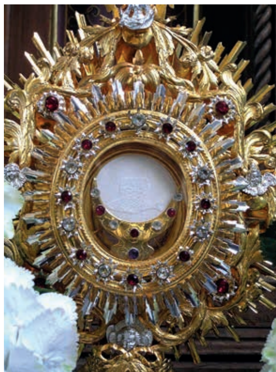
Fronleichnam auf Loretto