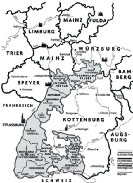
Abb. 23 Das Erzbistum Freiburg und die Oberheinische Kirchenprovinz

Wessenberg bei der Errichtung der Erzdiözese Freiburg 1821 ein hohes Ansehen in großen Teilen des fortschrittlichen Klerus und wurde von der Mehrheit der Dekane mit 66 Stimmen als Erzbischof vorgeschlagen. Der schließlich inthronisierte Erzbischof Bernhard Boll erhielt nur 5 Stimmen. Aber Wessenberg hatte inzwischen den Rückhalt des entscheidenden