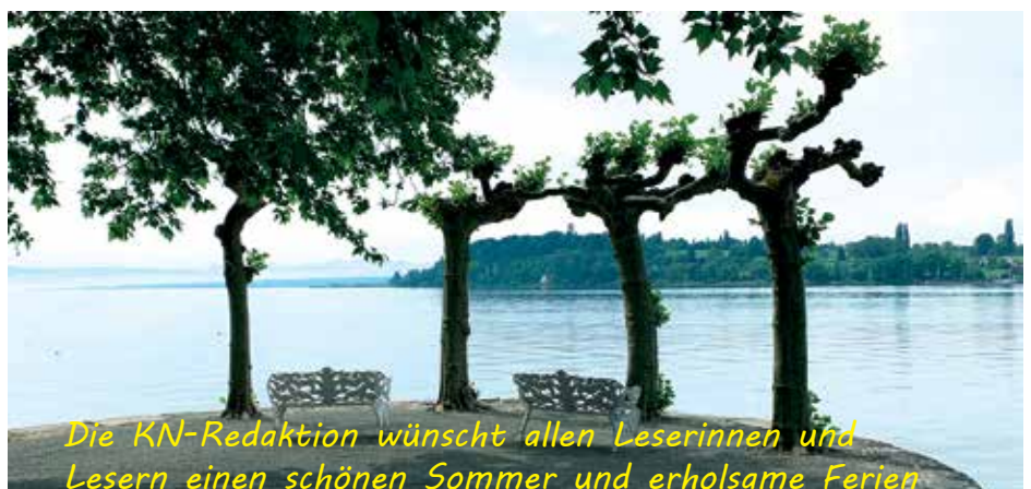
Die KN-Redaktion wünscht allen Leserinnen und Lesern einen schönen Sommer und erholsame Ferien