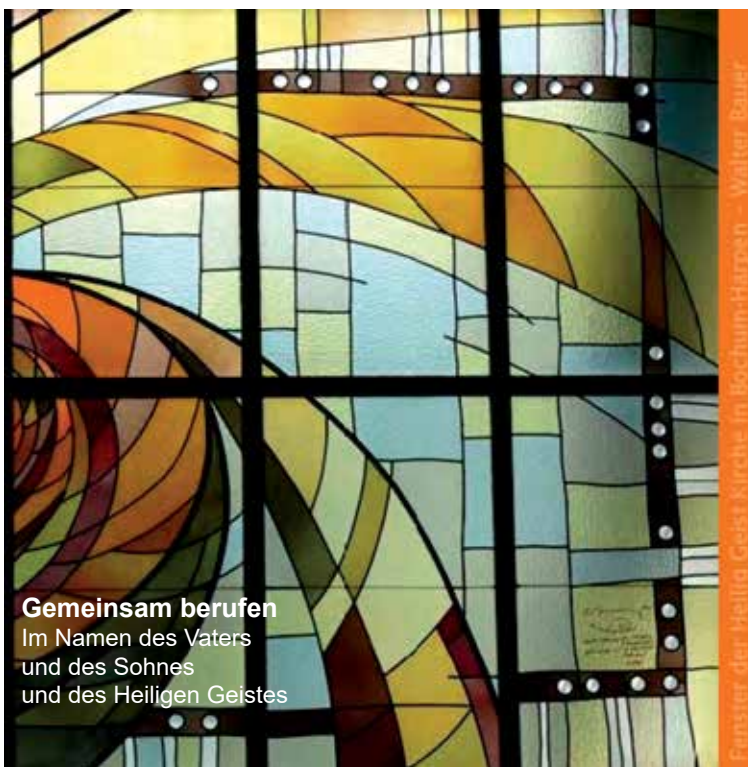
Gemeinsam berufen Im Namen des Vaters und des Sohnes und des Heiligen Geistes

„Freude und Hoffnung, Trauer und Angst der Menschen von heute, besonders der Armen und Bedrängten aller Art, sind auch Freude und Hoffnung, Trauer und Angst der Jünger Christi“, so hat es das II. Vatikanische Konzil (GS 1) schon in den 1960er Jahren formuliert. „Strukturen sind ohne Zweifel wichtig. Sie sind aber kein Selbstzweck, sondern stehen im Dienst einer Aufgabe. So wie es das Diktum der Bauhaus-Architektur auf den Punkt bringt: Form follows function – Die Form folgt der Funktion, auch in der Kirche.