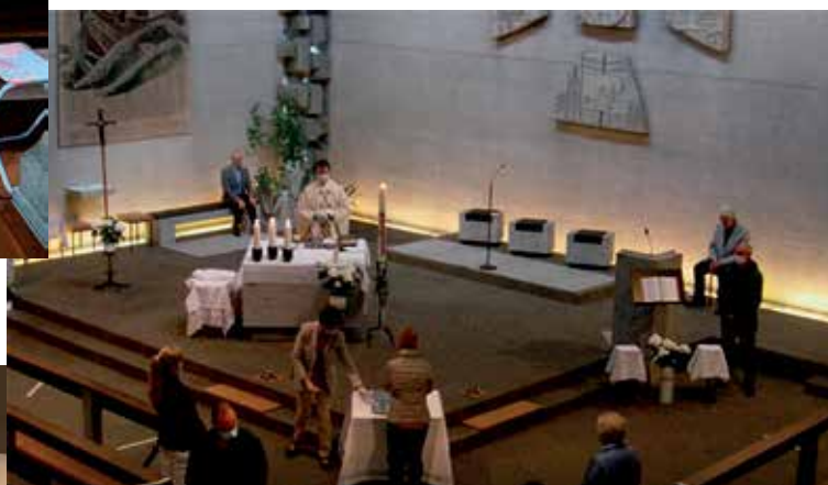
^ St. Gallus, Konstanz