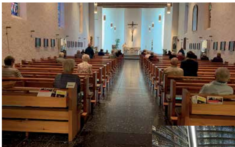
< St. Georg, Konstanz