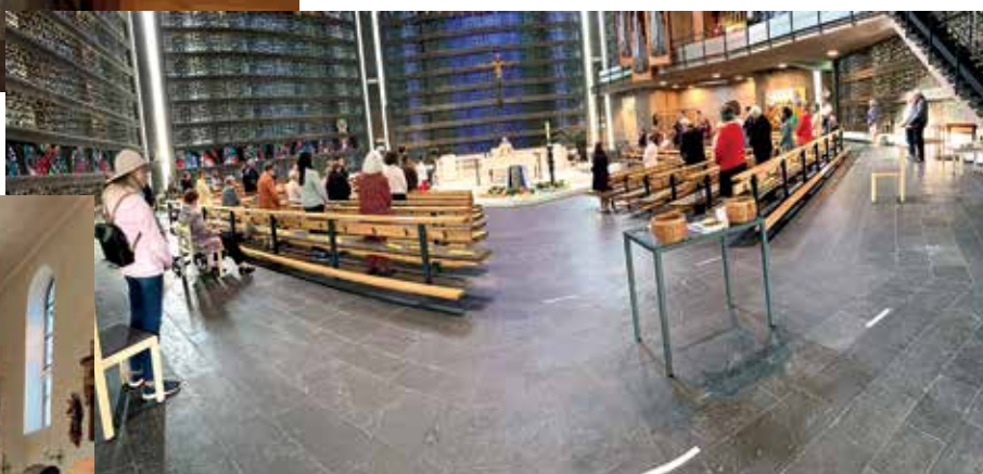
v Maria Hilf, Konstanz