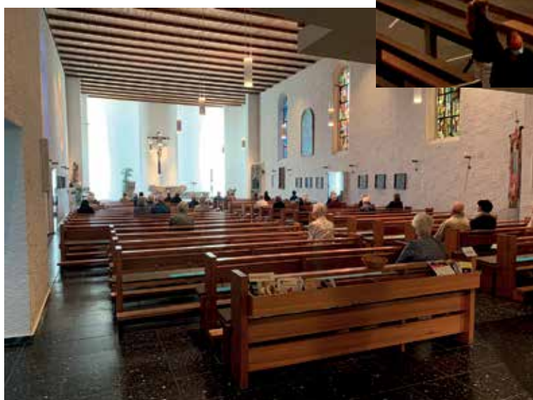
< St. Georg, Konstanz