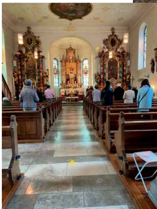
< St. Nikolaus, Allensbach