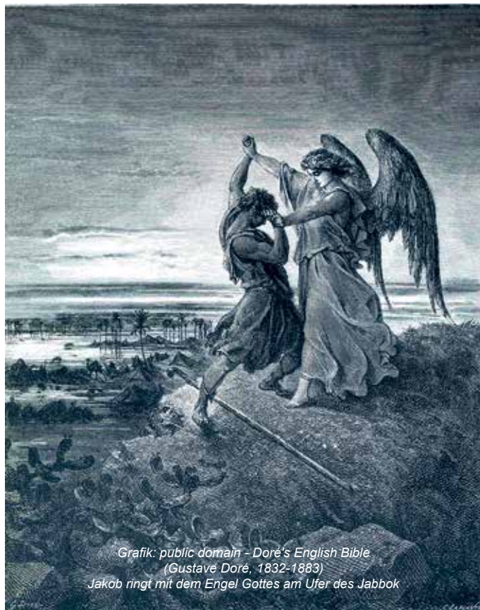
Jakob ringt mit dem Engel Gottes am Ufer des Jabbok

Die Brüder Jakob und Esau, sind nicht einfach Protagonisten einer Erzählung, sie stellen die zwei Daseins-Formen unserer menschlichen Natur dar. „Als Inhaber des Erstgeburtsrechts verkörpert Jakob [jetzt], der Überlieferung nach, die göttliche Seele im Menschen [...], hebräisch Neschamah.“ s.103 Während Esau, als bildhafte Entsprechung für unsre körperliche Existenz, die Jagd liebt. „Jagen bedeutet: Entwickeln, forschen, sich ausdehnen, neue Wege suchen, sich die Natur gefügig machen. Die Jagd spielt sich im Sichtbaren, Konkreten der Körperwelt ab. [...] Dort gelten die „Jagdgesetze“: Das Recht des Stärkeren, die Auslese, die Effektivität, die Nützlichkeit, der Lustgewinn.“ s.105f