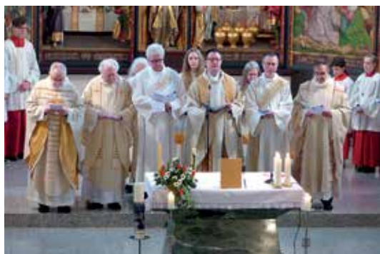
Wollmatingen - Allensbach